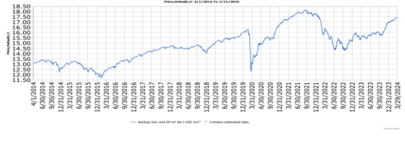
I類美元累積型淨值(單位：元)

資料來源：Lipper, (左)2014/4/1-2024/3/31, (右)2014/4/1-2024/3/31