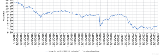
G類美元季配息型淨值(單位：元)

資料來源：Lipper, (左)2014/4/1-2024/3/31, (右)2014/4/1-2024/3/31