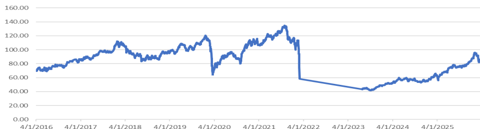
Barings Eastern Europe I USD ACC(IE00B3L6NX17)