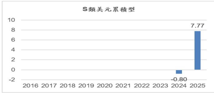
S類美元累積型(成立日 2024/9/10) %